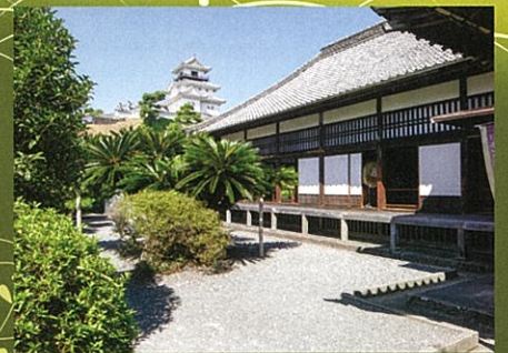
●掛川城御殿の案内図