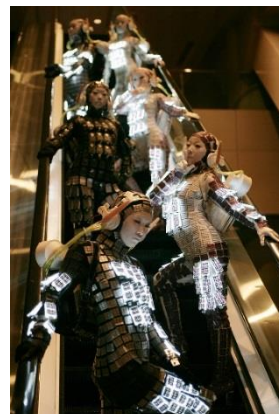
Keitai Girl in Hong Kong